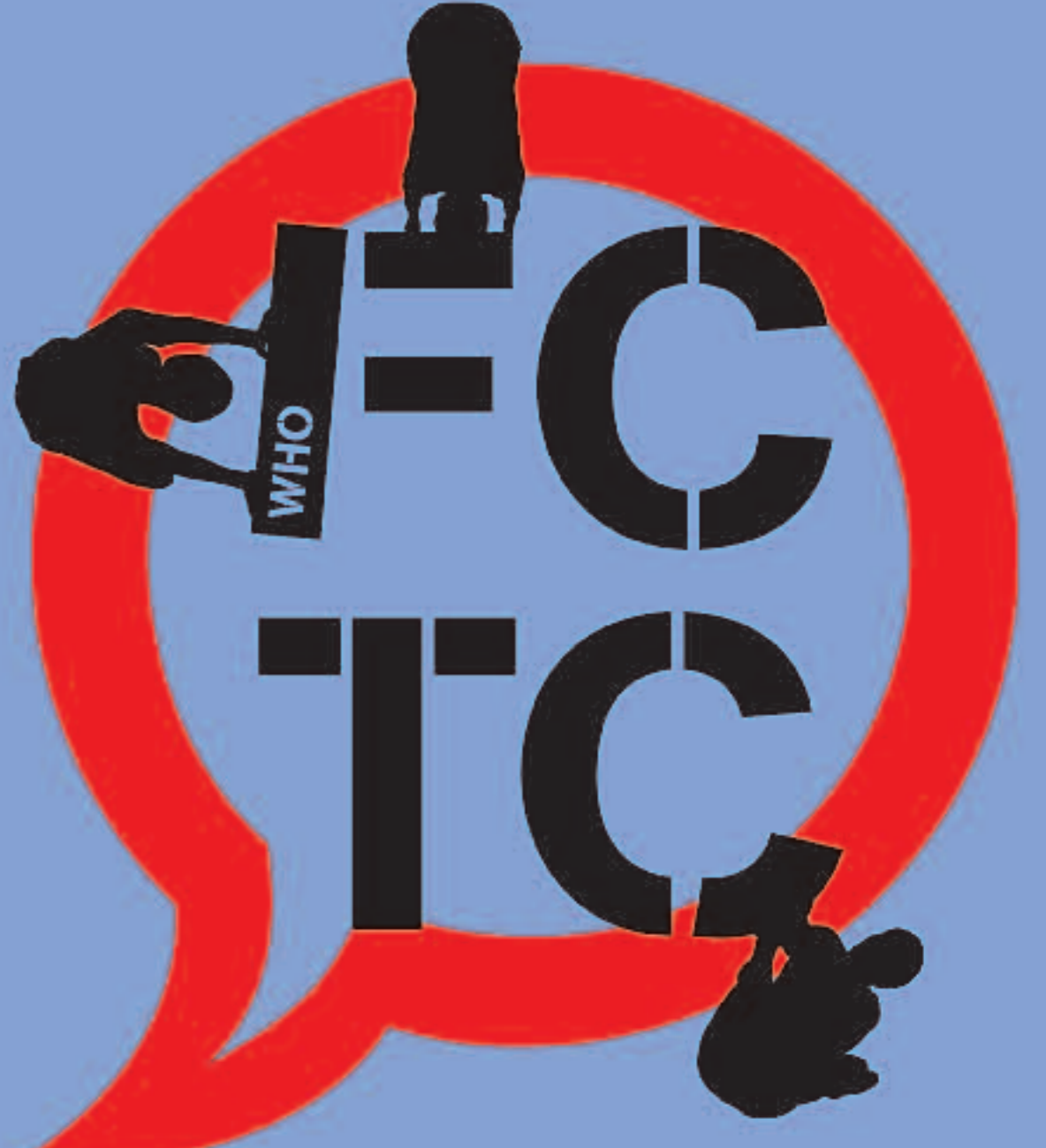
PROFESSIONALS SANITARIS CONTRA EL TABAC #11. RECOLZE EL CONVENI MARC PER AL CONTROL DEL TABAC DE L'OMS