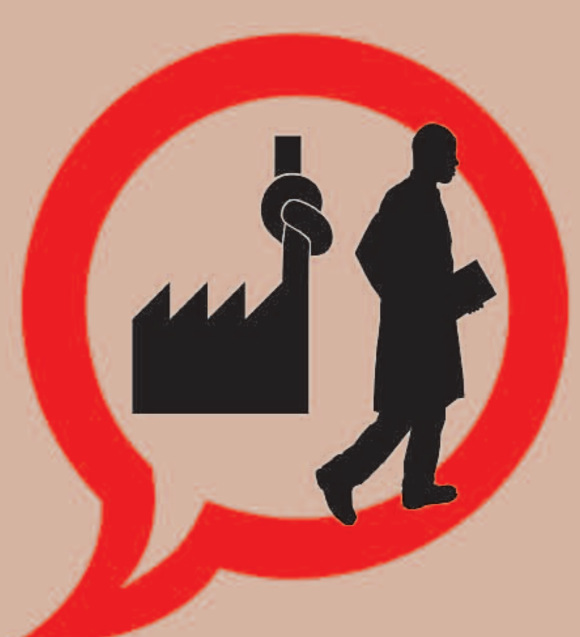
PROFESSIONALS SANITARIS CONTRA EL TABAC #9. NO T'ASSOCIES AMB LA INDÚSTRIA TABAQUERA