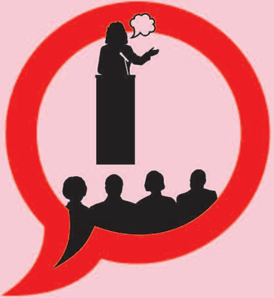
PROFESSIONALS SANITARIS CONTRA EL TABAC #4. DEBAT TAMBE SOBRE EL TABAC