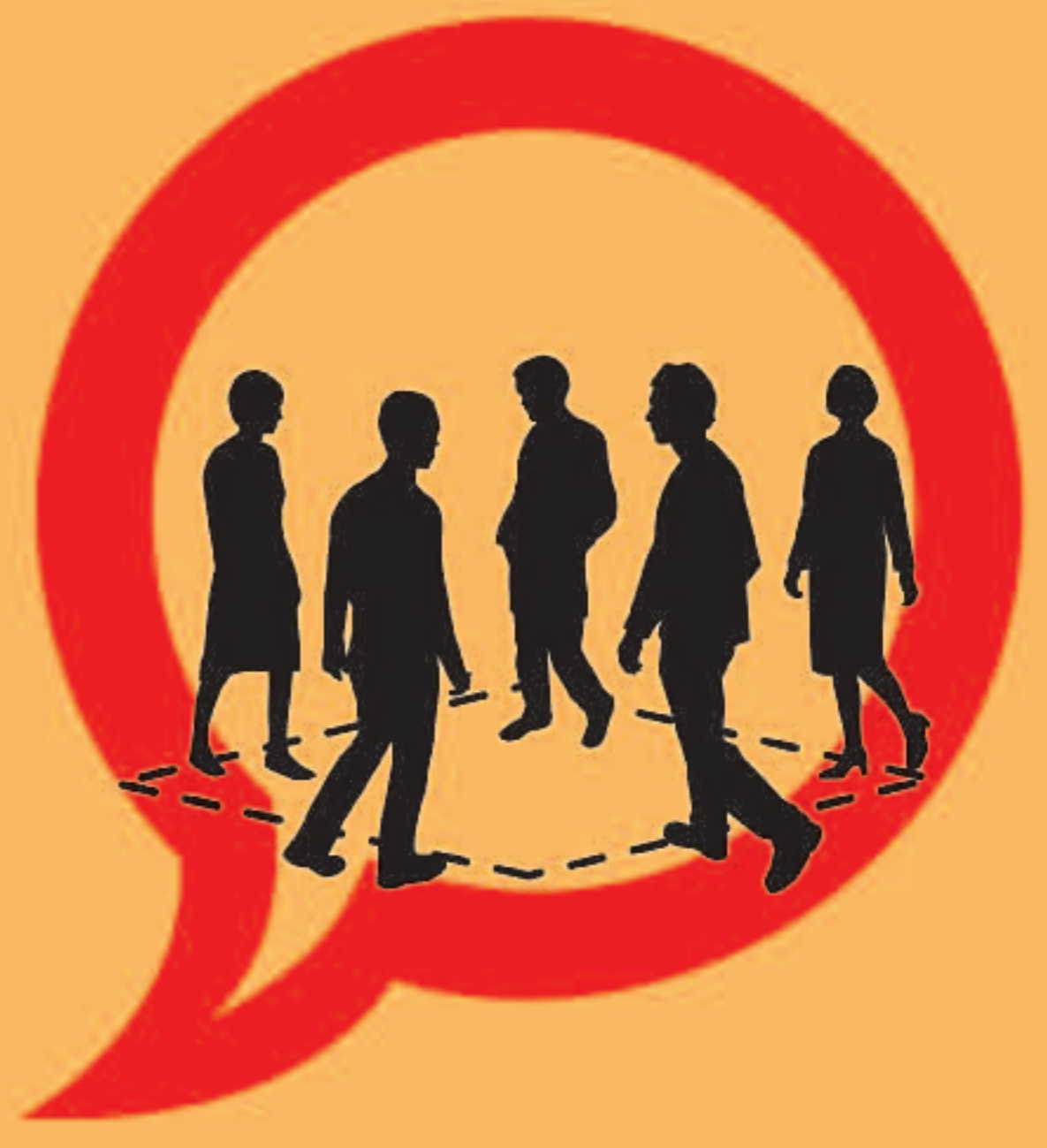
PROFESSIONALS SANITARIS CONTRA EL TABAC #14. DONA EL TEU SUPORT A LLOCS PÚBLICS SENSE FUM