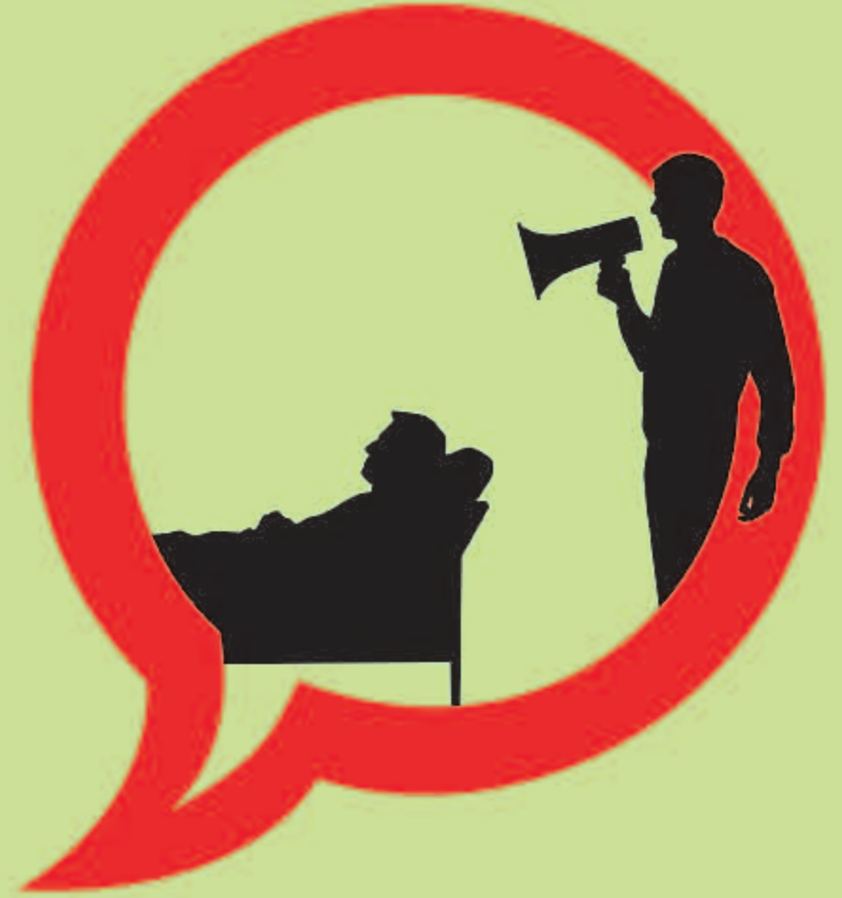
PROFESSIONALS SANITARIS CONTRA EL TABAC #5. RECOMANA ABANDONAR L'HÀBIT DE FUMAR