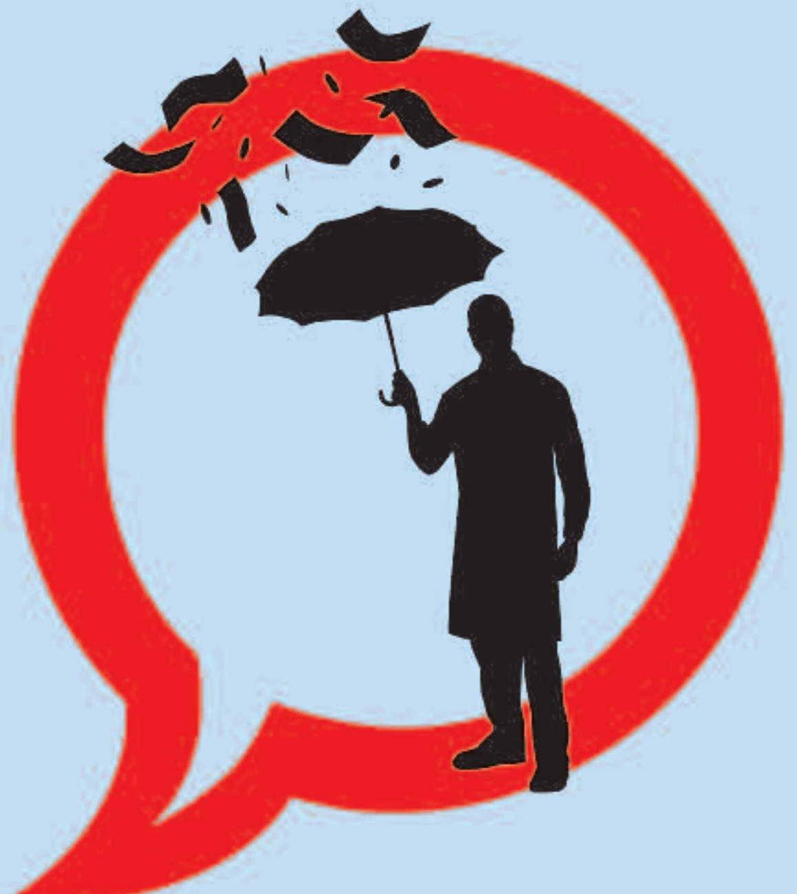
PROFESSIONALS SANITARIS CONTRA EL TABAC #8. REBUTJA DINERS QUE PROVIENGUEN DEL TABAC