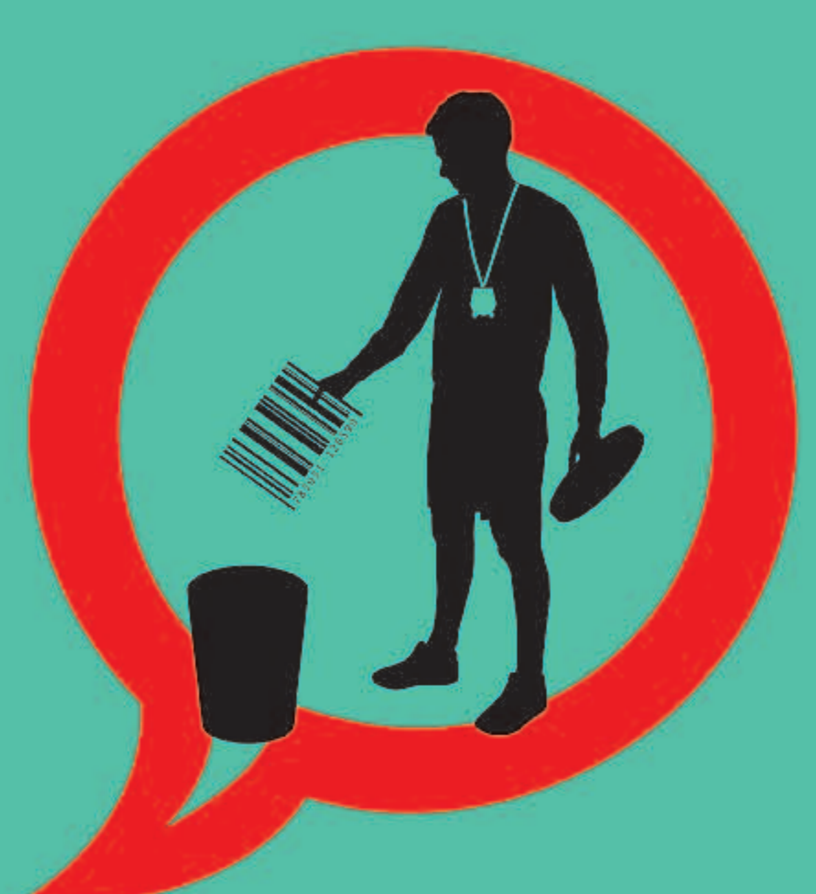
PROFESSIONALS SANITARIS CONTRA EL TABAC #10. PROHIBIX LA PROMOCIÓ I LA PUBLICITAT DEL TABAC