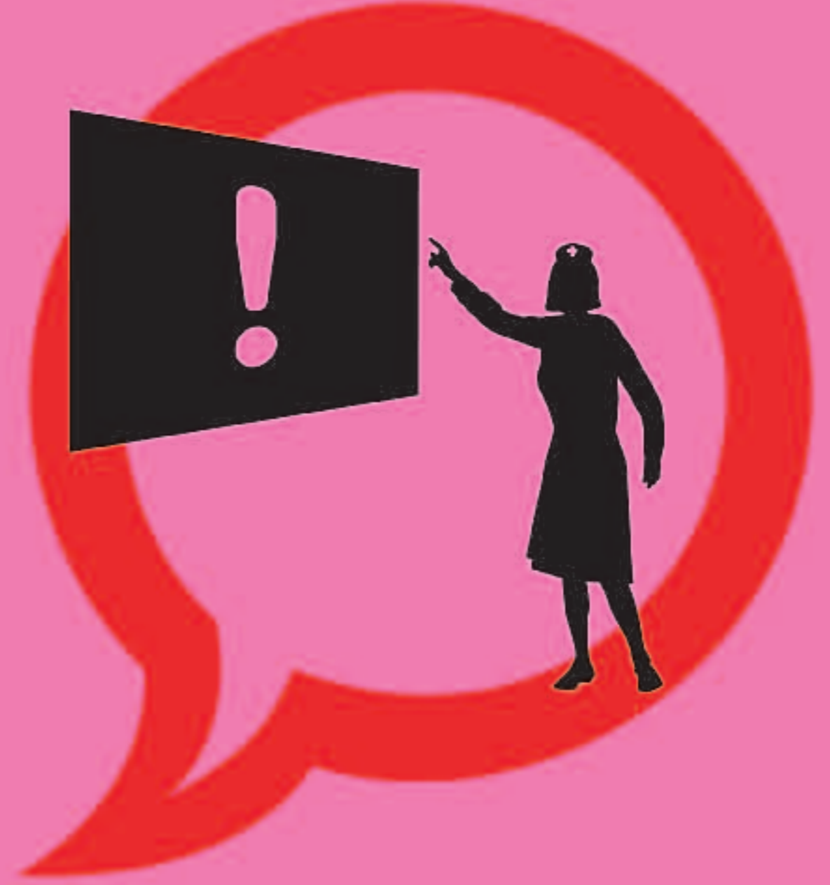
PROFESSIONALS SANITARIS CONTRA EL TABAC #6. EDUCA SOBRE EL TABAC