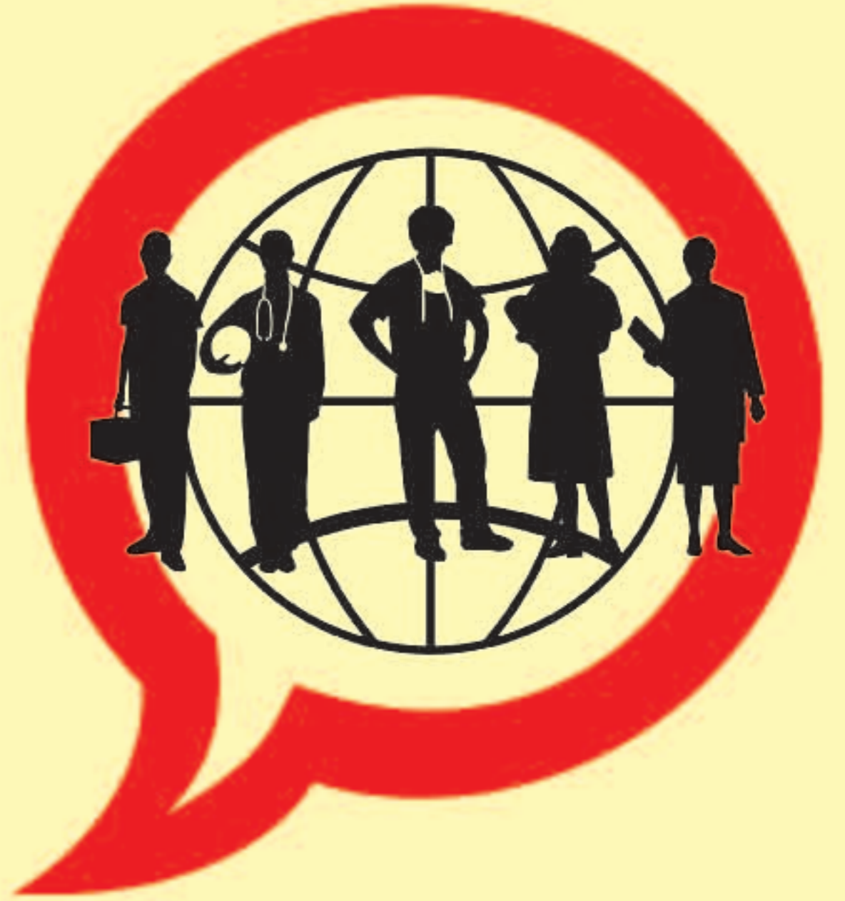
PROFESSIONALS SANITARIS CONTRA EL TABAC #7. PARTICIPE EN EL DIA MUNDIAL SENSE TABAC