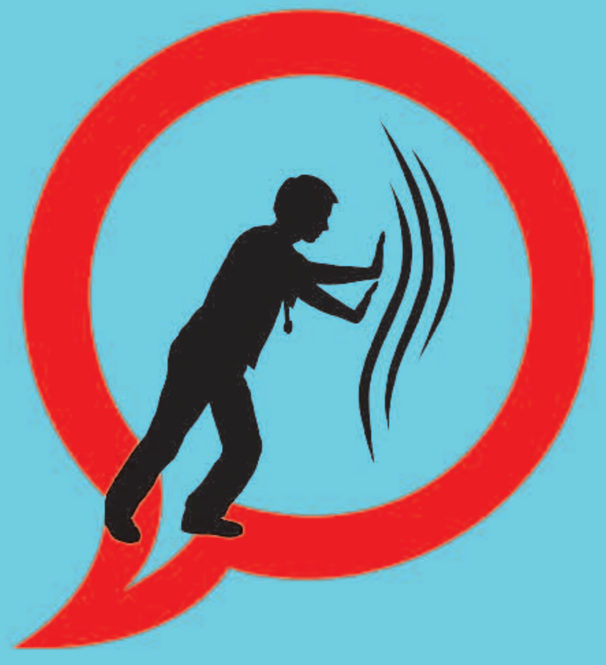
PROFESSIONALS SANITARIS CONTRA EL TABAC #13. SIGUES ACTIU EN EL CONTROL DEL TABAC