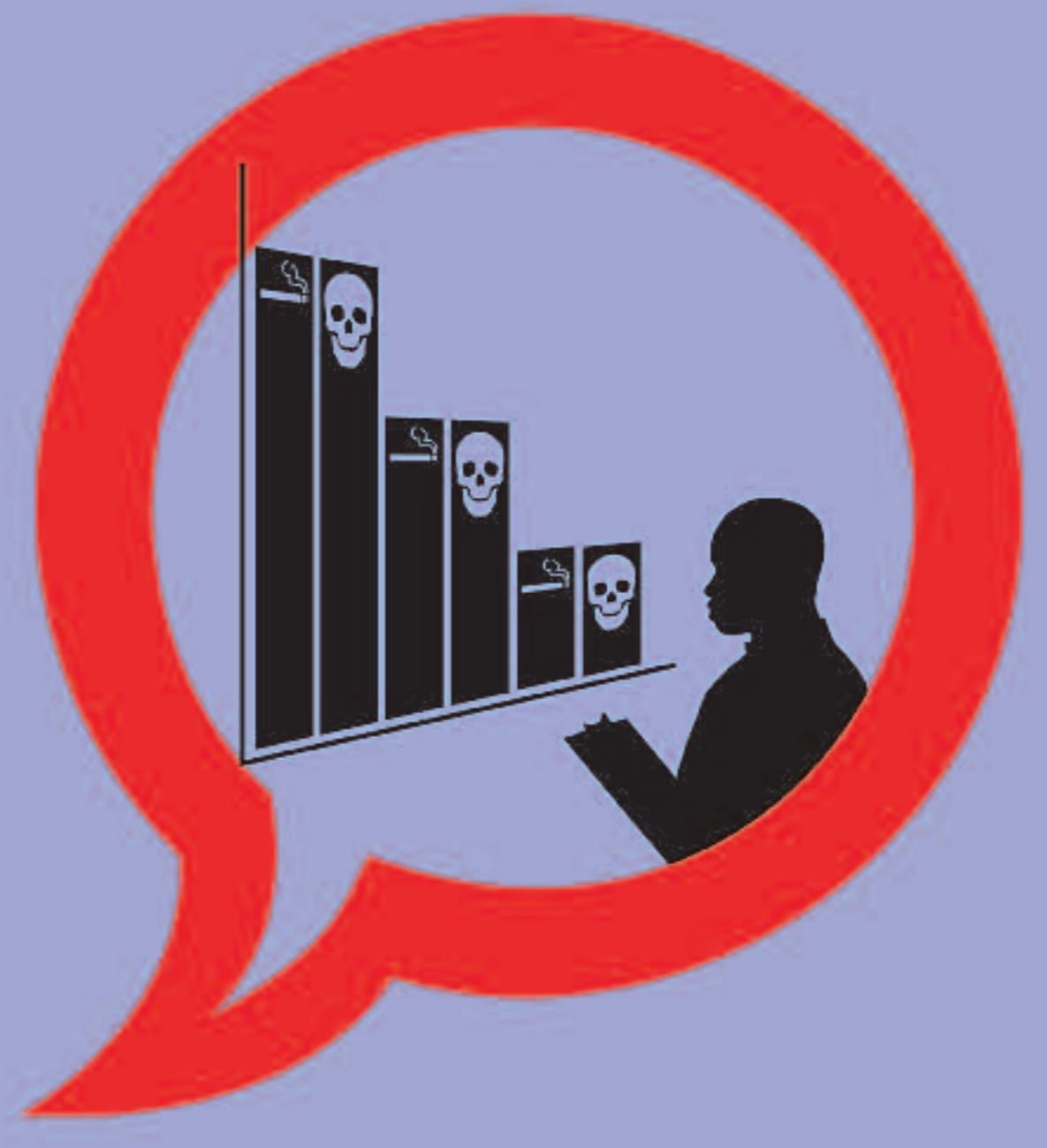
PROFESSIONALS SANITARIS CONTRA EL TABAC #2. AVALUA I AFRONTA EL PROBLEMA DEL TABAC