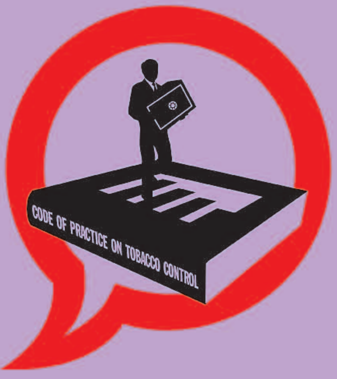
PROFESSIONALS SANITARIS CONTRA EL TABAC #12. INVERTIX EN EL CONTROL DEL TABAC