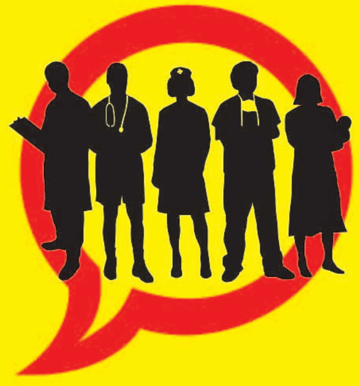
PROFESSIONALS SANITARIS CONTRA EL TABAC #1. SIGUES UN MODEL DE CONDUCTA